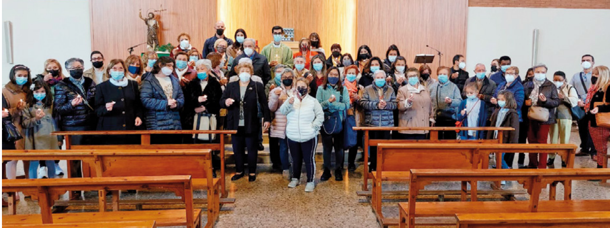
Acció 24h de Mans Unides a la Parròquia de Sant Joan Baptista de Sant Feliu de Llobregat

Des de Mans Unides, un gran agraïment a tots els mossens i els feligresos que han fet possible aquestes activitats amb el seu esperit solidari.